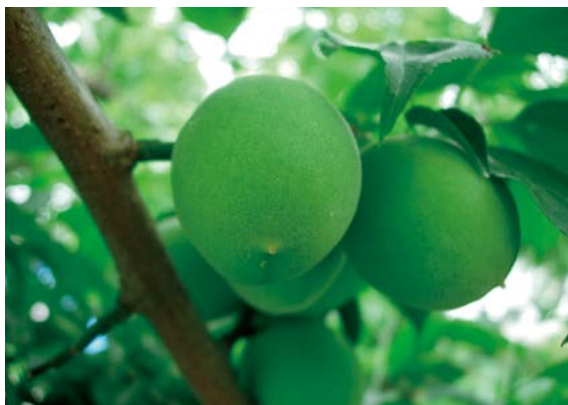
大粒の白加賀の果実（写真は群馬県提供）

資料：農林水産省「特産果樹生産動態等調査」より当研究所で計算 注：全国出荷量のおおむね8割を占める上位都道府県を対象とする