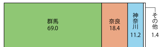
図表3 「白加賀」の収穫量（2022年・構成比%）