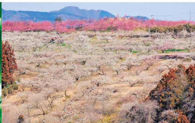
広大な梅林（箕郷町）